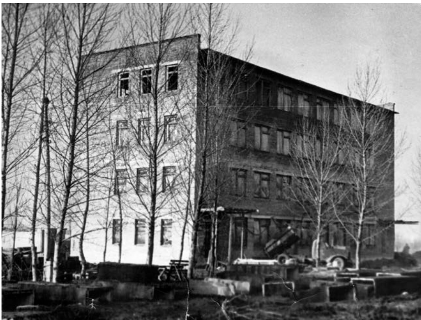
Строительство Первомайского РОВД, 1970 г.