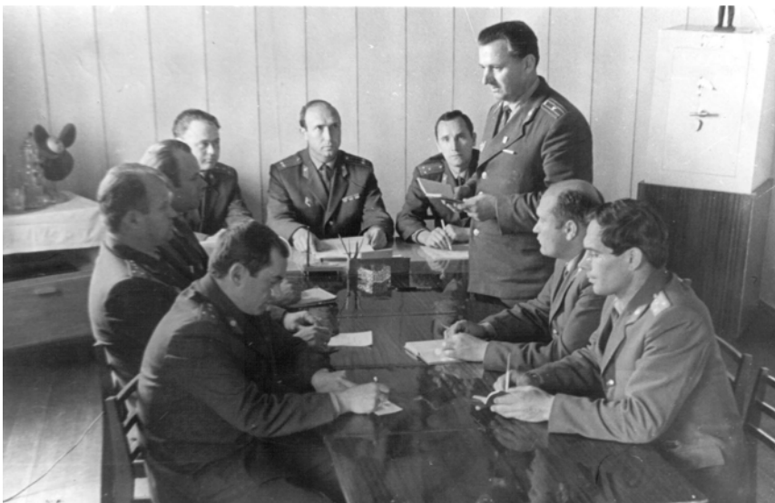
Оперативное совещание, 1976 г.