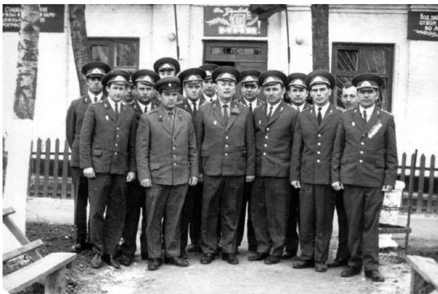
Основной состав офицеров Первомайского РОВД.