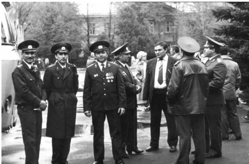
Перед строевым смотром.