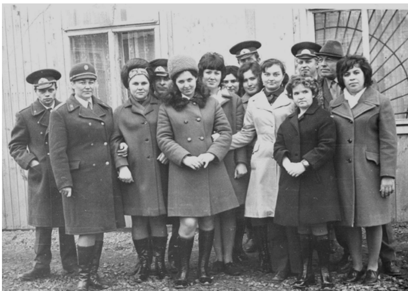
Сотрудники Первомайского РОВД, ноябрь 1974 г.