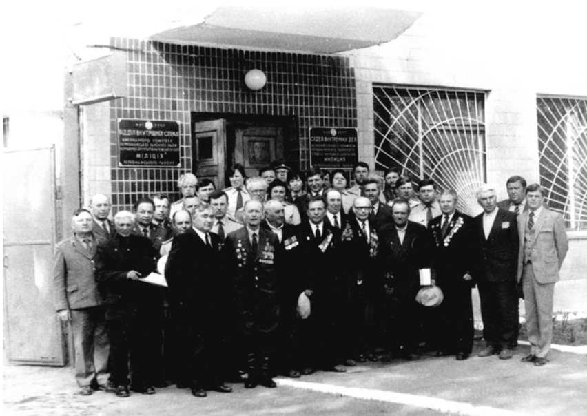
День Победы, 1986 г. Ветераны МВД.