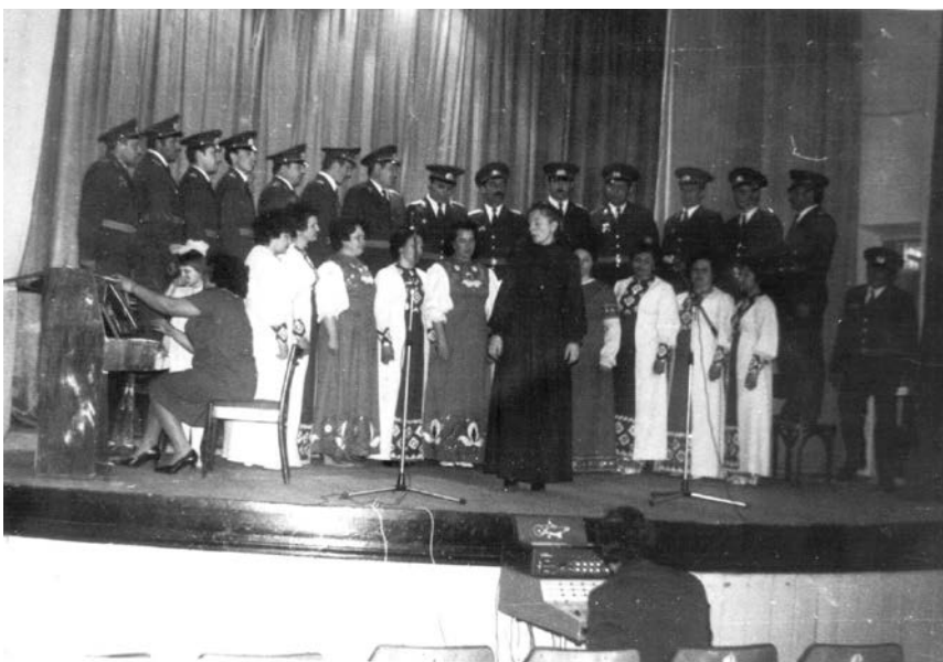
Смотр художественной самодеятельности.