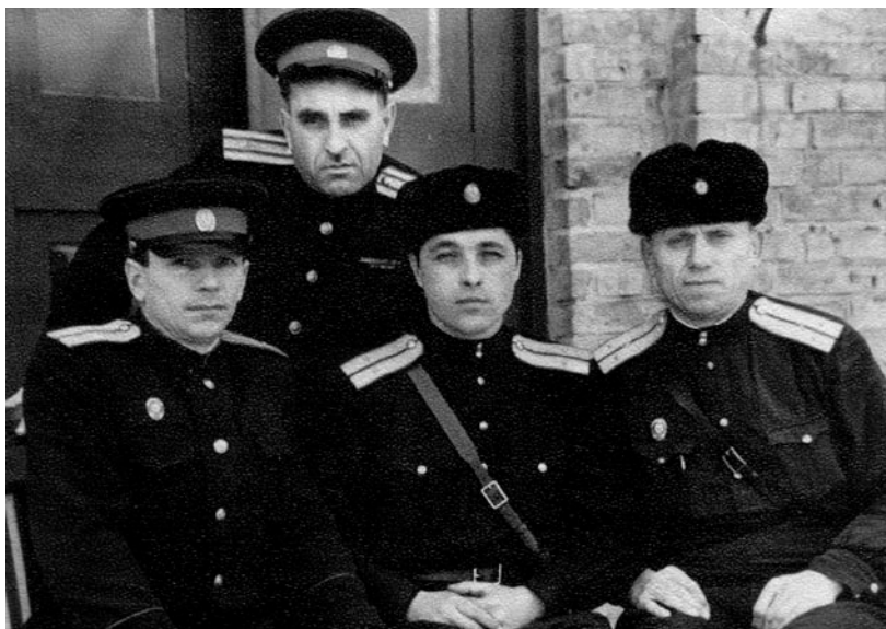
Офицеры Первомайской милиции – депутаты местных советов.