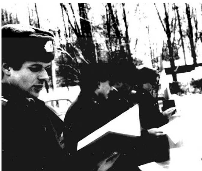
Принятие присяги, 1991 г.