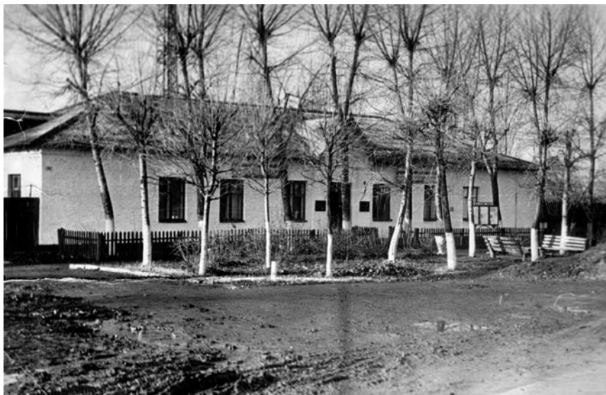
Здание Первомайского РОВД, 1965 г.