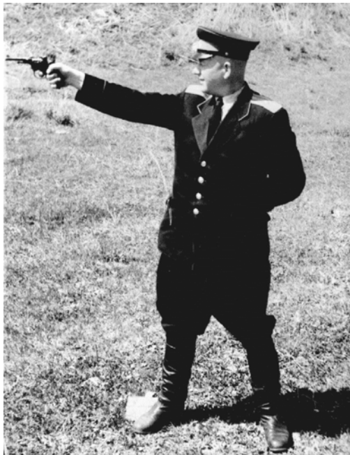
Бандиту не уйти, 1965 г.