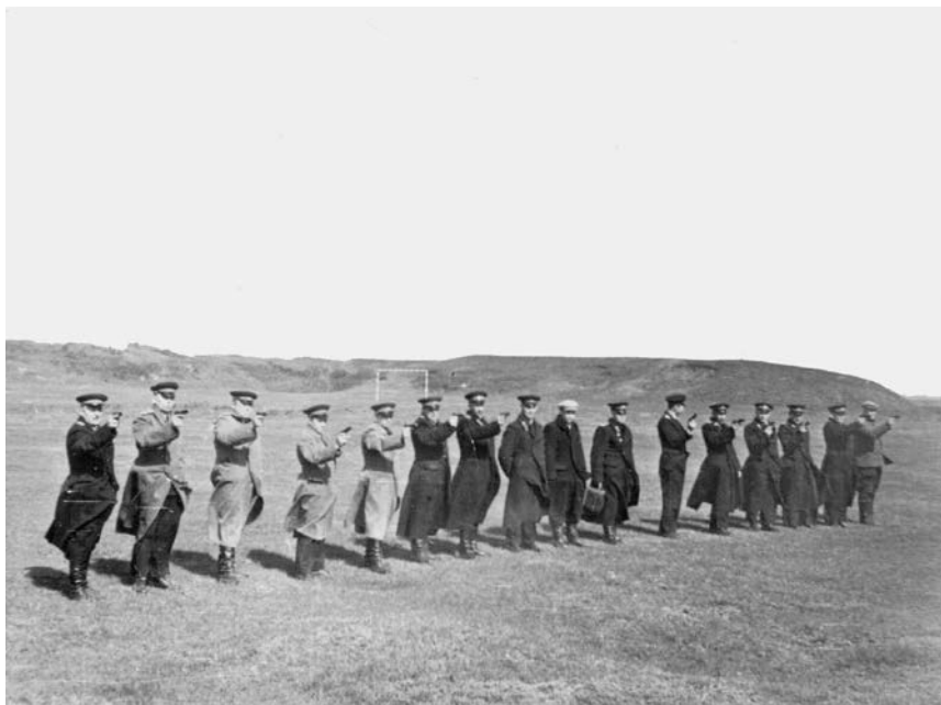
Учебные стрельбы, 1965 г.